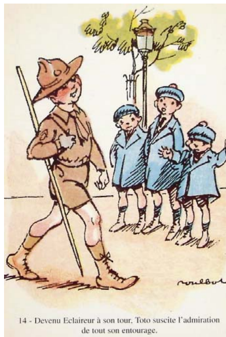
Carte postale éditée par la Mission populaire évangélique, 1928