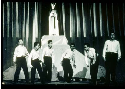
Les comédiens routiers des Scouts de France 1929-1939