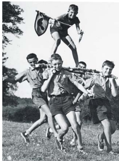
Scouts de France, 1959, photo Manson