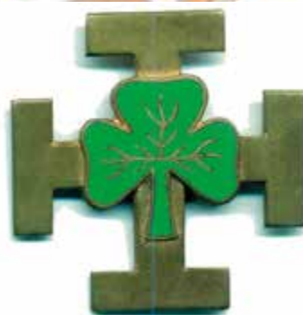
L'insigne des guides