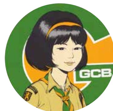
Autocollant Yoko Ono des guides catholiques de Belgique