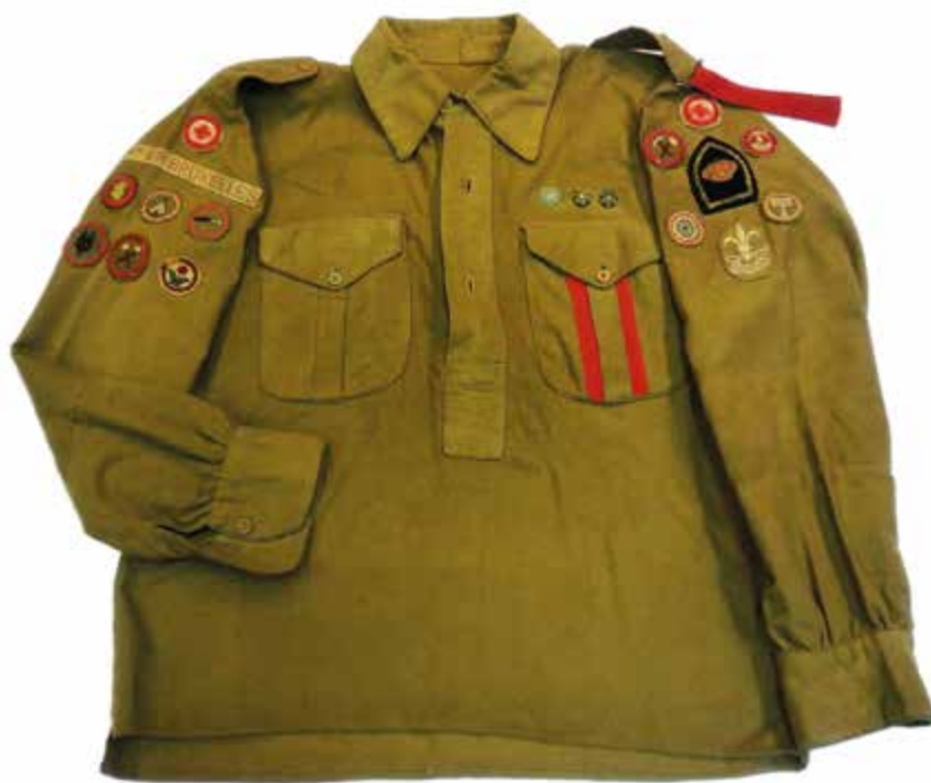
Rare : uniforme de 1918

Il y a certainement quelque chose de l'enfance qui reste en chaque adulte; au travers des expériences vécues lors des années de scoutisme, ceux d'entre nous qui l'ont pratiqué risquent d'être touchés par le pouvoir évocateur d'un monde désormais disparu qu'ont gardé les divers objets reliés à la pratique rassemblés en cette discrète et riche collection. Une expérience étrange. A tenter ! ●