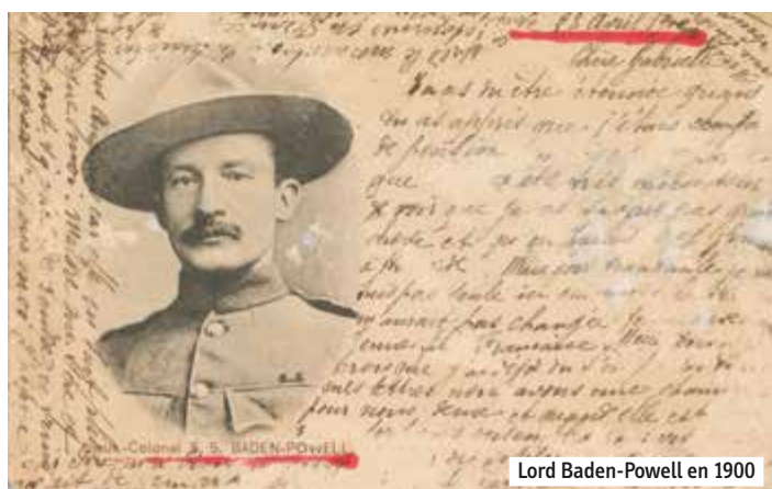
Lord Baden-Powell en 1900