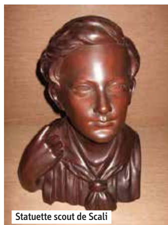
Statuette scout de Scali