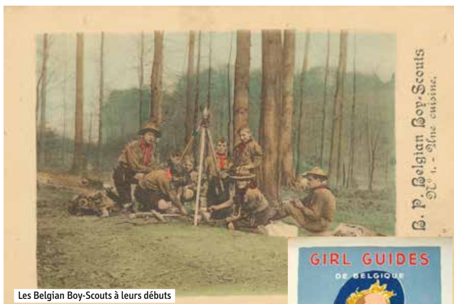
Les Belgian Boy-Scouts à leurs débuts