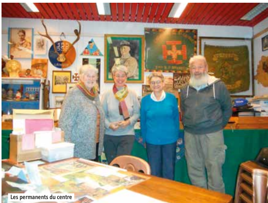
Les permanents du centre