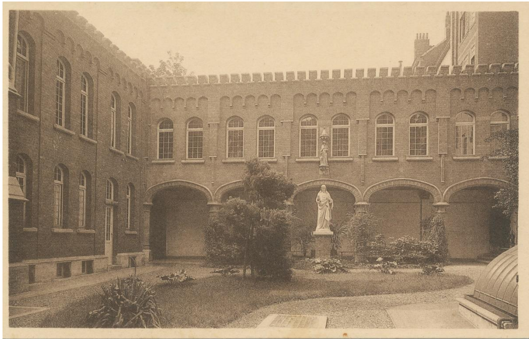
Le Couvent du Cénacle à St Gilles vers 1940

La 2 e du Cénacle avait un local dans un sous-sol du couvent, à côté de l'Economat. Elle se souvient d'une fête, avec un petit spectacle, avec des guides flamandes au Cénacle. Mais il n'y avait pas de vrais contacts. Il y avait peut-être des Anversoises au camp de Jusleville. Les réunions avaient lieu le jeudi après-midi et le dimanche, le matin et un dimanche par mois, toute la journée.